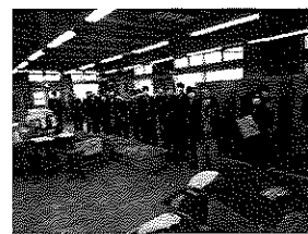
刑務所・少年院 スタディツアー